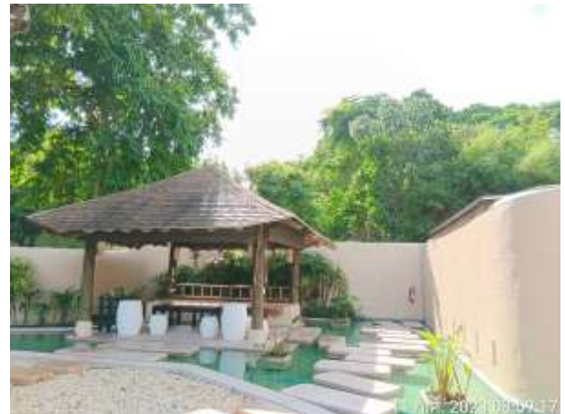
รูปที่ 2.22 สีผนังอาคารเป็นสีกันความร้อน