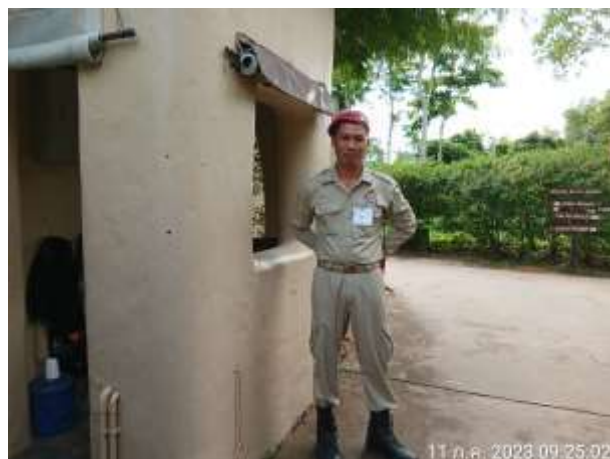
รูปที่ 2.7. รปภ.