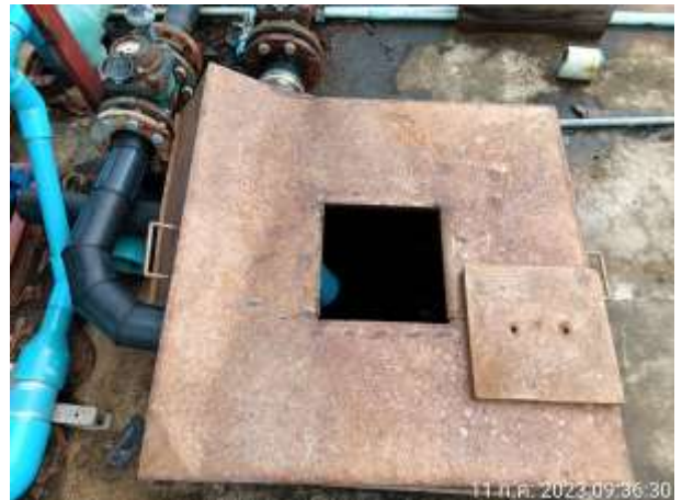
รูปที่ 2.9 ถังเก็บน้ำสำรอง