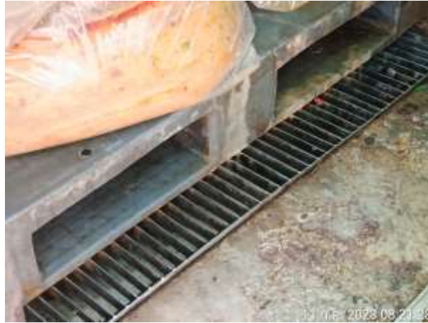
รูปที่ 2.32 ท่อระบายน้ำเสียในห้องพักขยะ