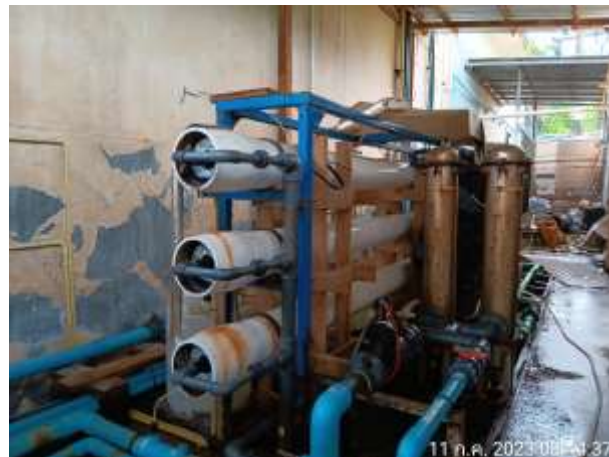
รูปที่ 2.29 ระบบกรองน้ำใช้