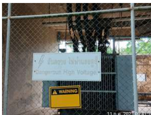
รูปที่ 2.20 ป้ายเตือนความปลอดภัยไฟฟ้าแรงสูง