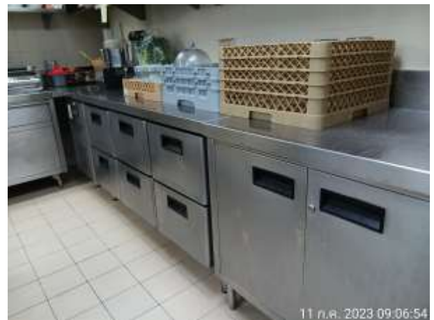
รูปที่ 2.31 ห้องครัว