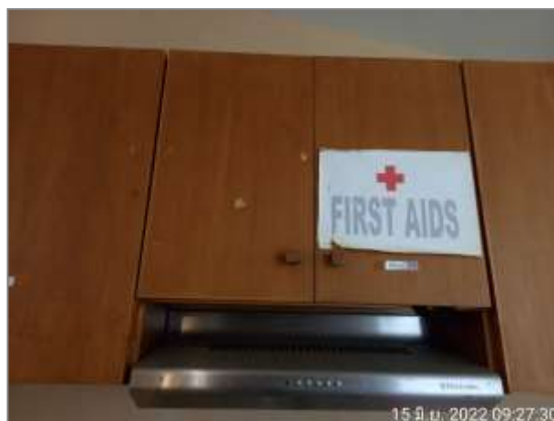
รูปที่ 2.27 อุปกรณ์ปฐมพยาบาลเบื้องต้น