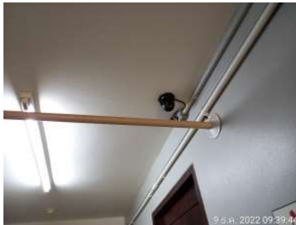
รูปที่ 2.25 CCTV