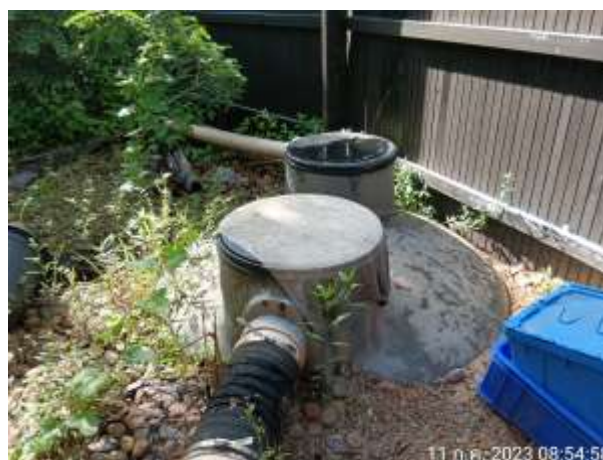
รูปที่ 2.16 บ่อดักไขมัน