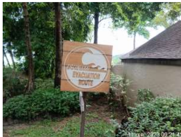
รูปที่ 2.3 พื้นที่หลบภัยสึนามิ