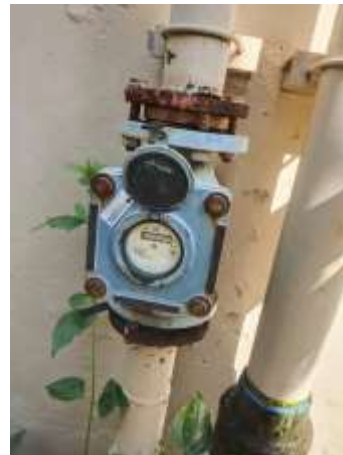
รูปที่ 2.15 มิเตอร์ระบบบำบัดแยกจากระบบไฟฟ้า