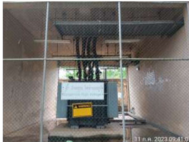
รูปที่ 2.18 หม้อแปลงไฟฟ้า