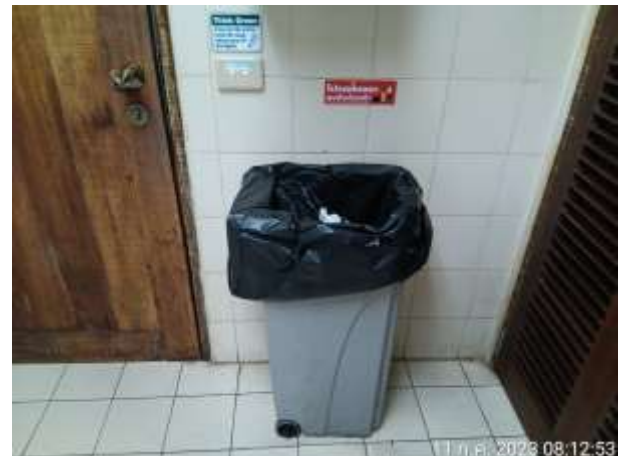
รูปที่ 2.35 ป้ายรณรงค์ทิ้งขยะลงถัง