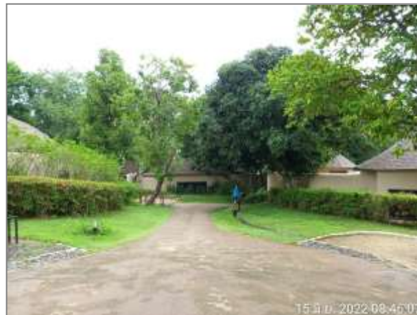
รูปที่ 2.12 ภาพชุดลอกตะกอน