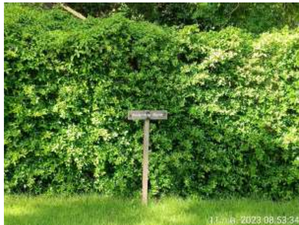
รูปที่ 2.6 จุดรวมพล