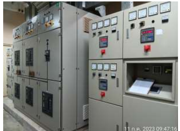
รูปที่ 2.33 ตู้ MDB