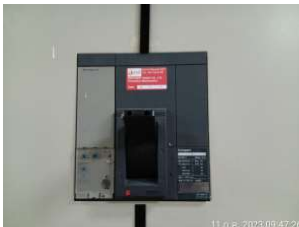
รูปที่ 2.34 circuit breaker