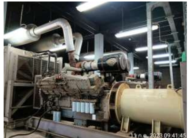
รูปที่ 2.19 เครื่องสำรองไฟฟ้า