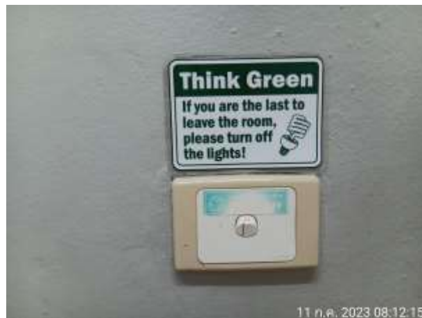
รูปที่ 2.28 ป้ายประหยัดพลังงาน