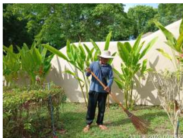
รูปที่ 2.31 คนสวน