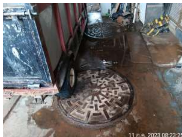
รูปที่ 2.13 ระบบบำบัดน้ำเสีย