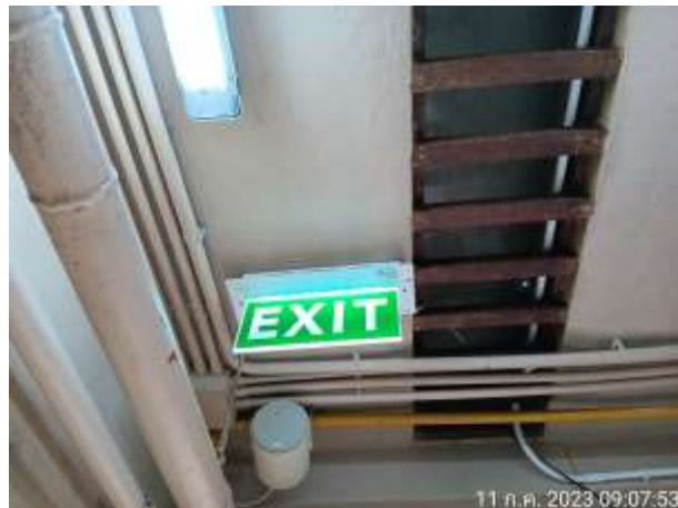
รูปที่ 2.5 ป้ายทางหนีภัย