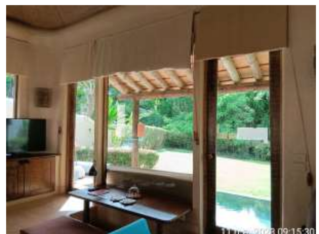
รูปที่ 2.36 ภาพโดยรวมของโครงการ