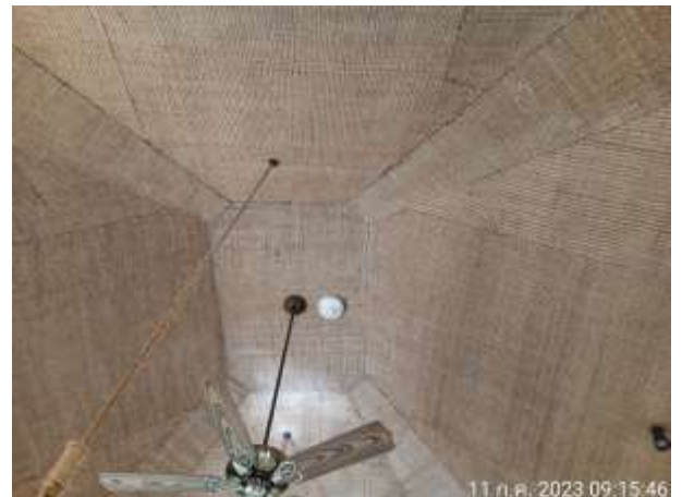
รูปที่ 2.23. ระบบป้องกันและแจ้งเตือนอัคคีภัย