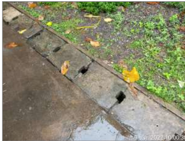
รูปที่ 2.2 บ่อพักน้ำ man hole