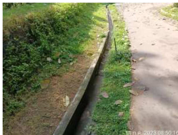
รูปที่ 2.30 รางระบายน้ำ