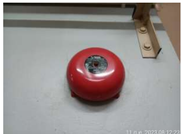
รูปที่ 2.23. ระบบป้องกันและแจ้งเตือนอัคคีภัย