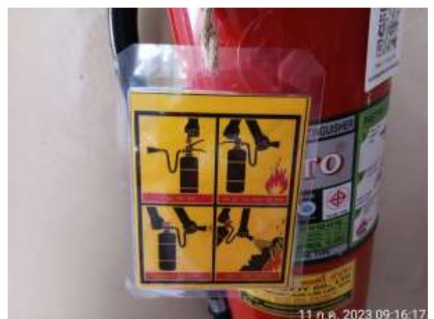
รูปที่ 2.24 ป้ายแสดงวิธีการใช้งานอุปกรณ์