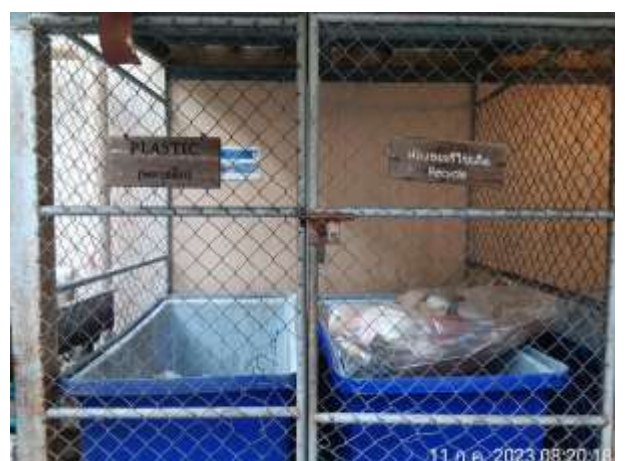
รูปที่ 2.17 ห้องพักขยะ