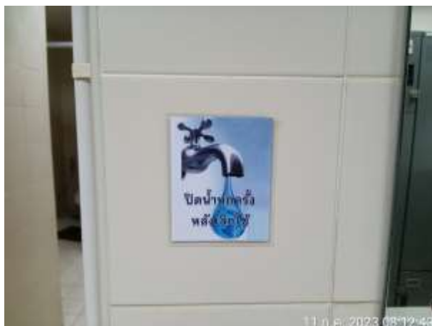
รูปที่ 2.10 ป้ายประหยัดน้ำ