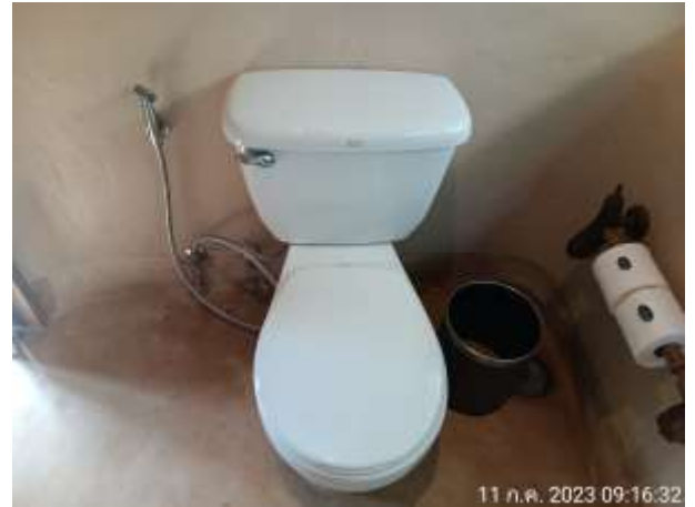
รูปที่ 2.11 สุขภัณฑ์ประหยัคน้ำ