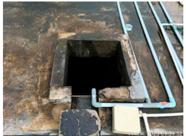
รูปที่ 2.14 บ่อพักน้ำผ่านการบำบัด + เครื่องเติมคลอรีน