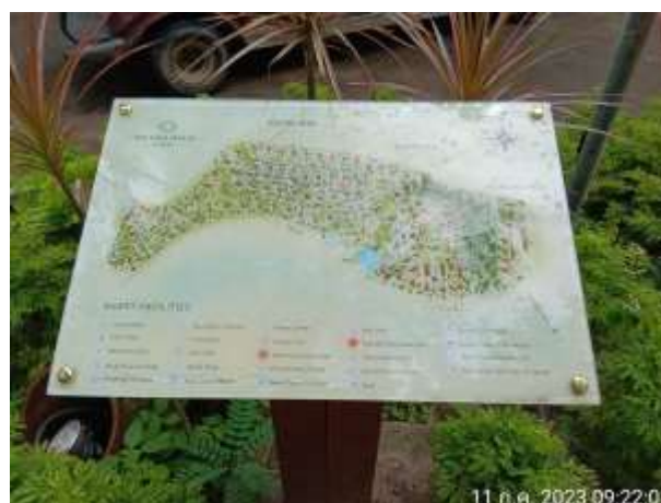
รูปที่ 2.4 แผนผังอพยพ