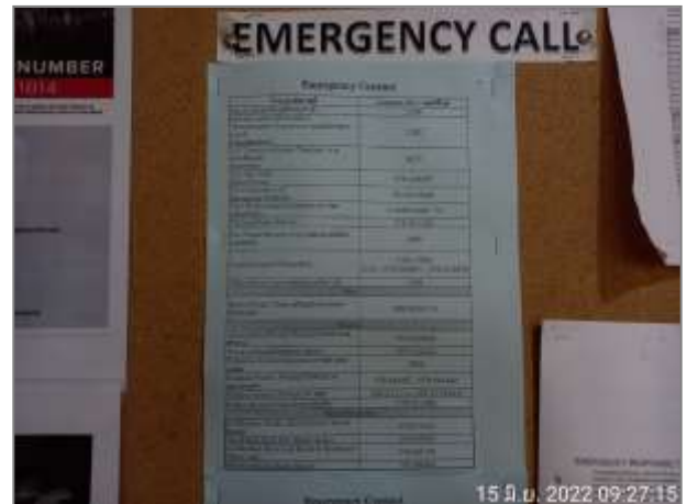
รูปที่ 2.26 เบอร์โทรฉุกเฉิน